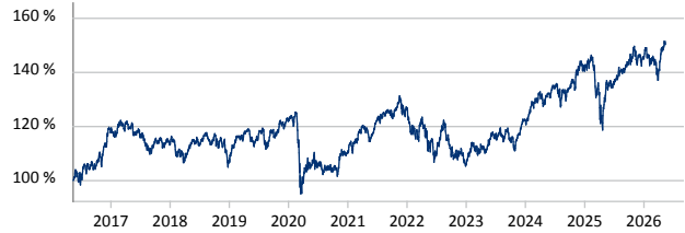
— Franklin Global Fundamental Strategies Fund A (acc) EUR