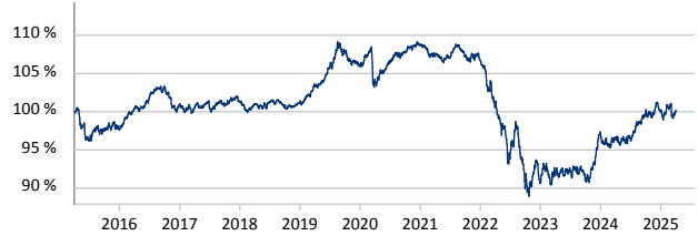
Kepler Ethik Rentenfonds (T)