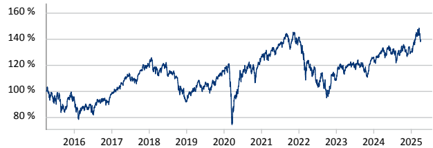
Fondak - A - EUR