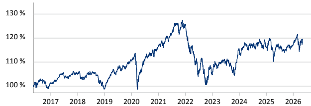
Kapital Plus - A - EUR