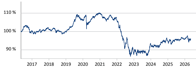
— DWS Euro Bond Fund LD