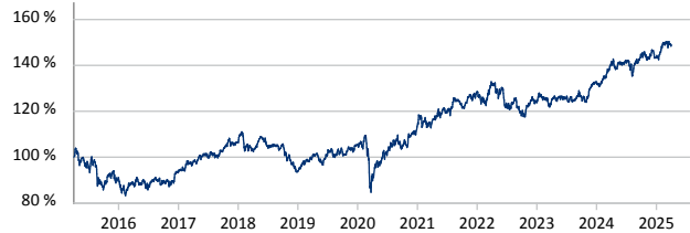
— FMM-Fonds P EUR