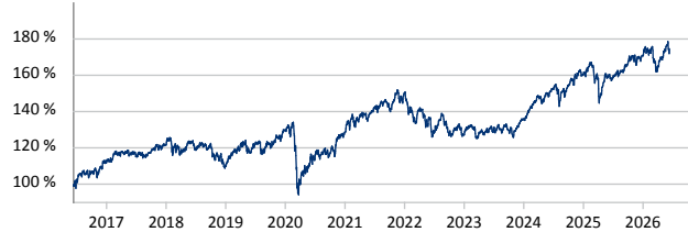
— RWS-DYNAMIK A