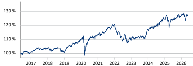
— ODDO BHF Polaris Moderate DRW-EUR