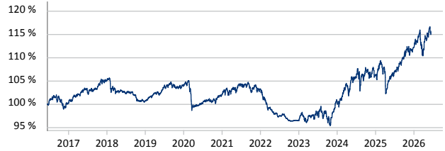
Metzler Wertsicherungsfonds 93 A