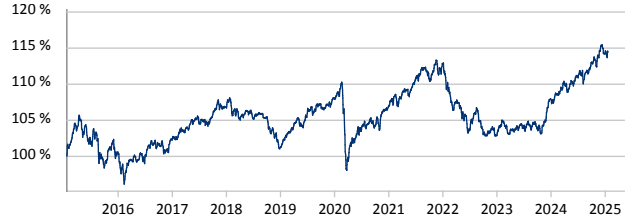
— MasterFonds-VV Ertrag