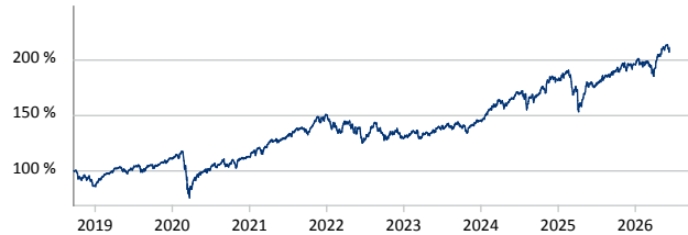
— ODDO BHF Global Equity Trend DRW-EUR