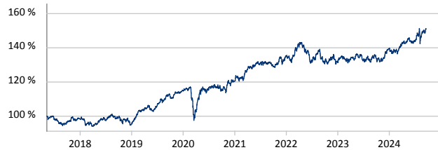
Value Intelligence ESG Fonds AMI I (a)