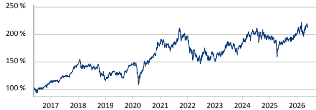
— GAM Star Japan Leaders Ordinary JPY Acc