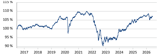
iShares € Corporate Bond Large Cap UCITS ETF EUR (Dist) Share Class