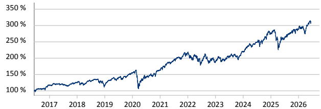
— Dimensional Global Core Equity Lower Carbon ESG Screened Fund EUR Acc