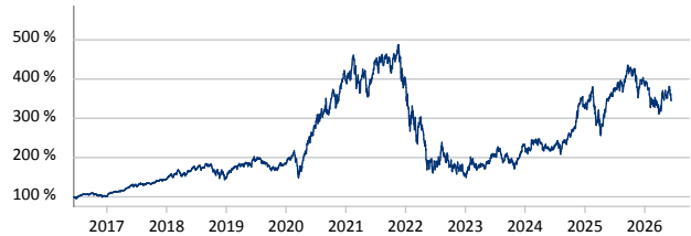
Morgan Stanley US Growth Fund A USD