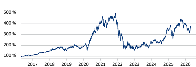
Morgan Stanley US Growth Fund A USD