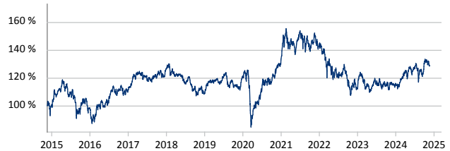
Janus Henderson Emerging Markets Fund A2 EUR