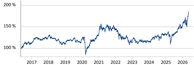
Janus Henderson Emerging Markets Fund A2 EUR