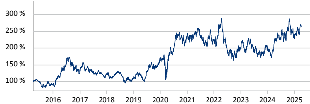
— M & W Capital