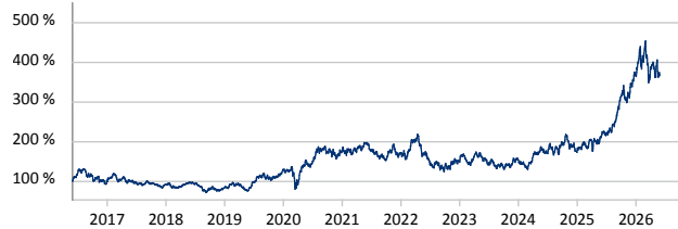
M & W Capital