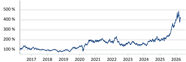
— M & W Capital