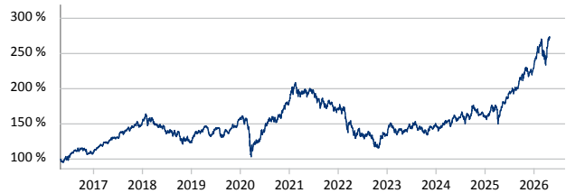
Templeton Emerging Markets Fund A (acc) USD