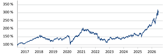
Templeton Emerging Markets Fund A (acc) USD