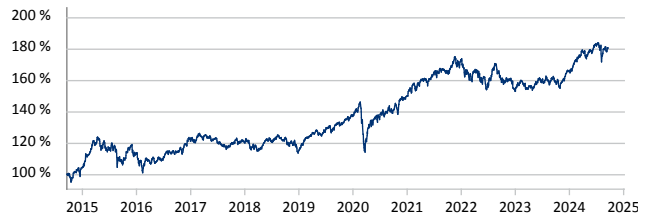
BlackRock Global Funds - Global Allocation Fund A2 EUR