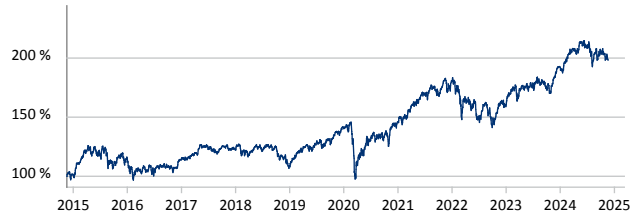
Janus Henderson Continental European Fund A2 EUR