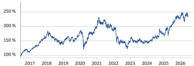
— Templeton BRIC Fund A (acc) USD