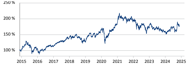
Fidelity Funds - Sustainable Asia Equity Fund A-ACC-Euro