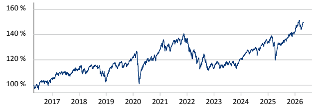
FFPB MultiTrend Doppelplus