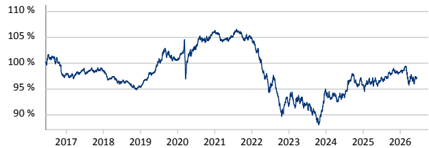
— JPM Aggregate Bond A (acc) - EUR (hedged)