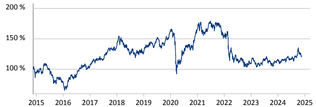
— HSBC GIF BRIC Equity AC