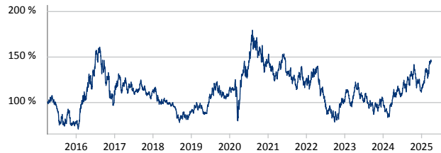
BlackRock Global Funds - World Gold Fund Hedged A2 CHF