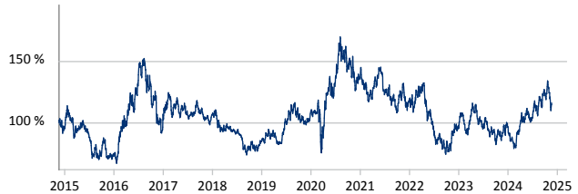
BlackRock Global Funds - World Gold Fund Hedged A2 CHF