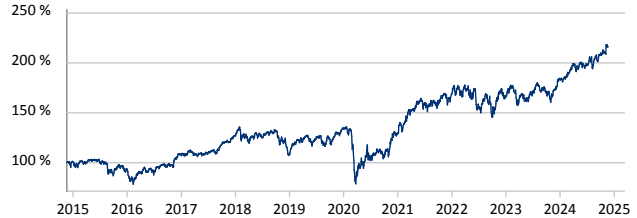
— Invesco US Value Equity Fund A Acc USD