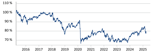
— B&B Fonds - Dynamisch