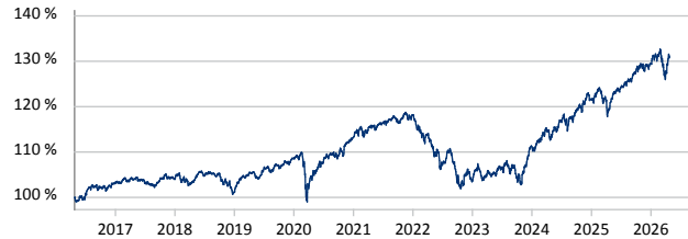
— Pictet - Multi Asset Global Opportunities - P EUR