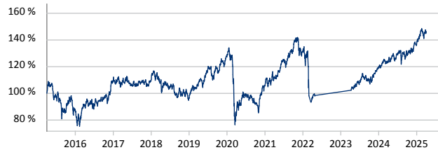
— Amundi Funds Emerging Europe Middle East and Africa - A EUR (C)