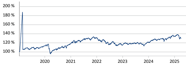
International Asset Management Fund - Top Ten Classic R