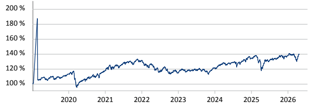
International Asset Management Fund - Top Ten Classic R